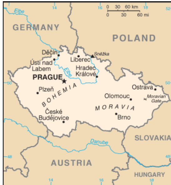
MAPA DA REPÚBLICA TCHECA